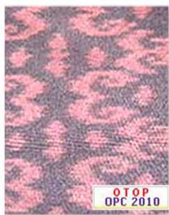
ผ้ามัดหมี่สีข้อมครามหมู่ ๖