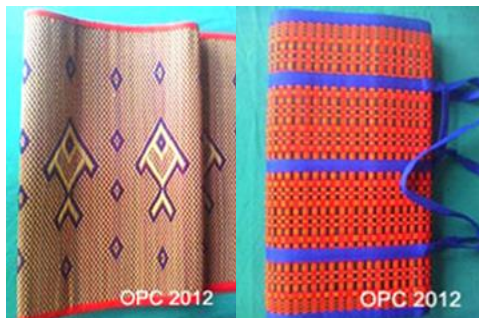
เสื่อกกลายประยุกต์หมู่ ๑๒