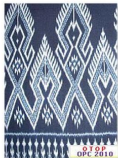
ผ้ามัดหมี่สีข้อมครามหมู่ ๕