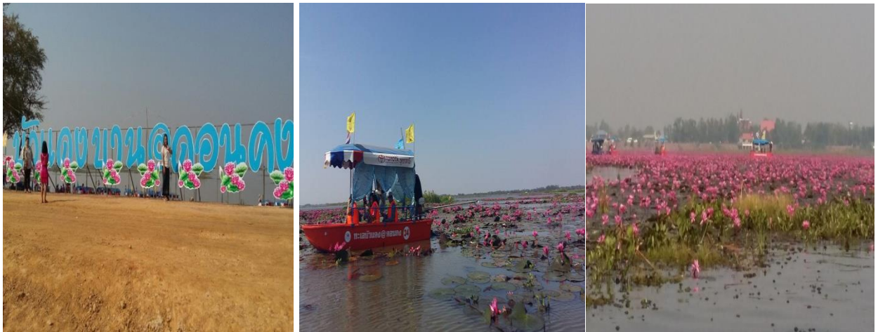
“ทะเลบัวแดง” บ้านดอนคง หมู่ ๒ ตำบลลุ่มงาน

ปัจจุบันหนองหาน “ทะเลบัวแดง” กำลังได้รับการปรับปรุงบริเวณทำน้ำต่าบลุ่มงาน อยู่ในเขตพื้นที่บ้านดอนคง หมู่ ๒ ซึ่งได้เปิดเป็นท่าเรืออย่างเป็นทางการ เมื่อวันที่ ๑๘ ธันวาคม ๒๕๕๘ เพื่อให้นักท่องเที่ยวได้มานั่งเรือเยี่ยมชมทะเลบัวแดงเป็นสถานที่พักผ่อนหย่อนใจล่องเรือชมทัศนียภาพรอบหนองน้ำและเป็นแหล่งท่องเที่ยวเชิงอนุรักษ์ได้อย่างประทับใจ เป็นที่ดึงดูดให้นักท่องเที่ยว ที่ชอบวิถีชีวิตแบบธรรมชาติได้เดินทางกลับมาเที่ยวสถานที่แห่งนี้ โดยประชาชนสามารถเข้ามาเที่ยวชมทะเลบัวแดงได้ตั้งแต่ เดือนธันวาคม-กุมภาพันธ์ของทุกปี โดยเวลาที่สามารถชมดอกบัวแดงบานที่สวยงามที่สุดคือในช่วงเช้าตรู่ ถึงเวลา ๑๑.๐๐ น. โดยในช่วงเช้าบัวแดงจะบานเต็มที่แดดไม่แรง อากาศเย็นสบาย โดยจะมีเรือคอยให้บริการนักท่องเที่ยวจากการรวมกลุ่มของชาวบ้านในตำบลลุ่มงาน มีเรือคอยให้บริการนักท่องเที่ยวจำนวน ๗๘ ลำ นั่งได้ ๕-๗ คน ราคาเที่ยวละ ๓๐๐-๕๐๐ บาท (เหมาลำ) ขึ้นอยู่กับระยะทาง แต่ละลำมีเสื้อชูชีพสำหรับนักท่องเที่ยวทุกคนให้เที่ยวชมทะเลบัวแดงด้วยความปลอดภัย