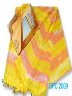
ผ้าลายน้ำไหล หมู่ ๕